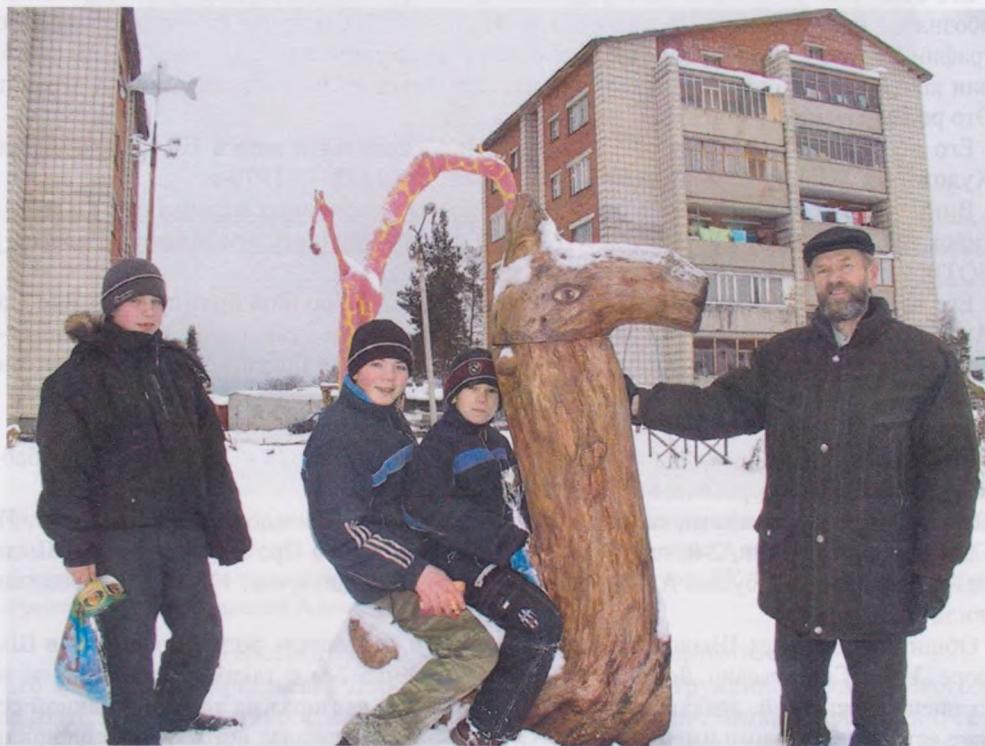
Рукотворная фантазия художника-дизайнера. Зима 2008г.