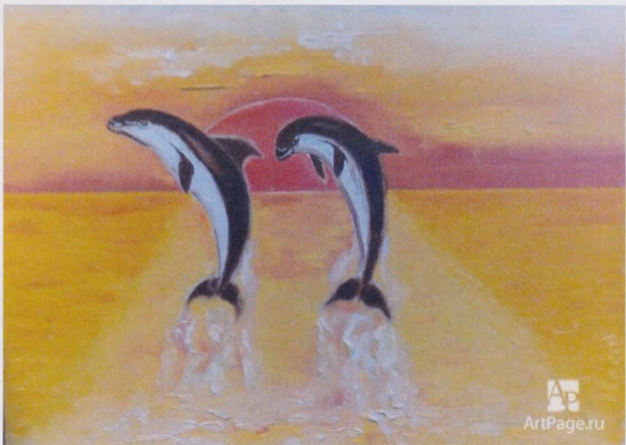
Копия с Интернета. Иллюстрация картины «Дельфины на закате», масло, 1999 год.