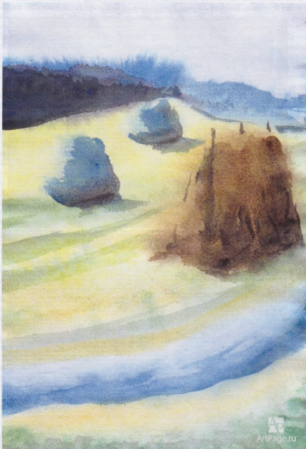
Копия с Интернета. Иллюстрация картины «Покос», акварель, 2010 год.