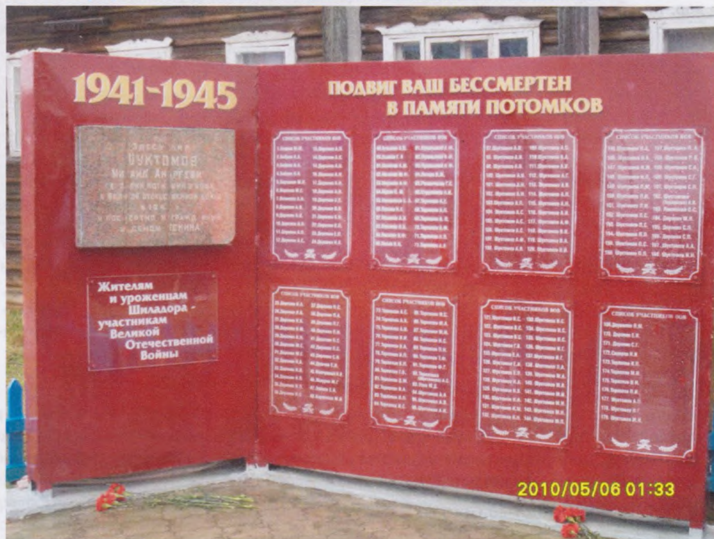
Обелиск Участникам ВОВ Шыладоре, и погибшим, и вернувшимся, и уроженцам этого села, и её жителям, связанным своей судьбой с этим, когда-то большим населенным пунктом. Всего обозначены на нём 179 человек, среди которых две женщины, здесь же отец Художника и много его родственников. В ходе дальнейших поисков нашлись имена ещё 26 воинов, их следует тоже разместить на этом обелиске.