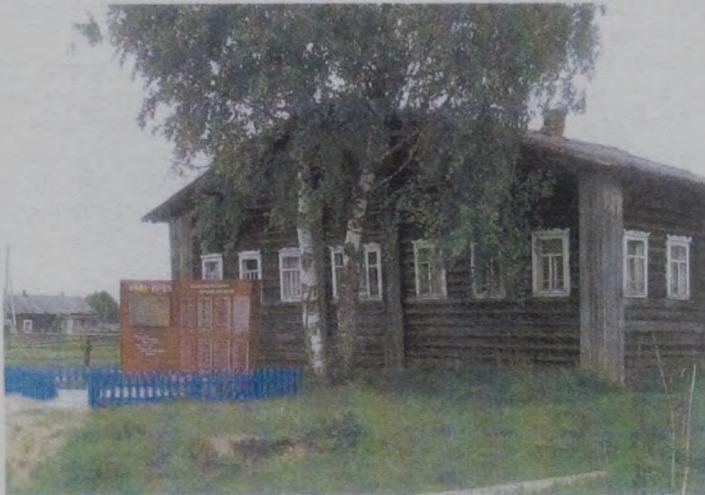
Сыктывкар. 2011 год.