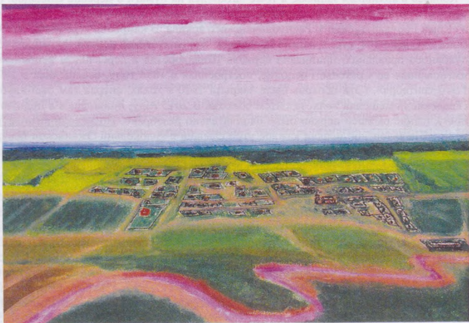
“Родные просторы”, масло 2005 г., автор Доронин А. А.

Копия изображения из книги Впс «Наша родословная. 2-е издание», 36 страница.